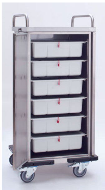
131300 mit Endoboxen/ Deckeln/Plomben