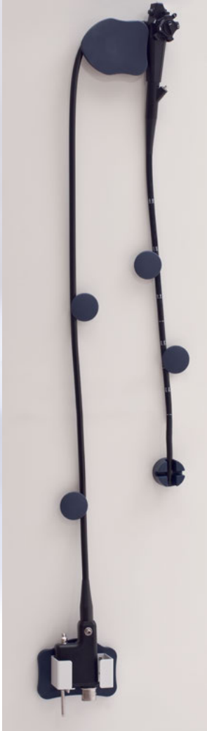
Magnetische Endoskophalterung (EBS 8-C.51)