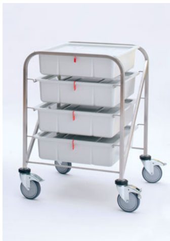
131152 mit Endoboxen/ Deckeln/Plomben